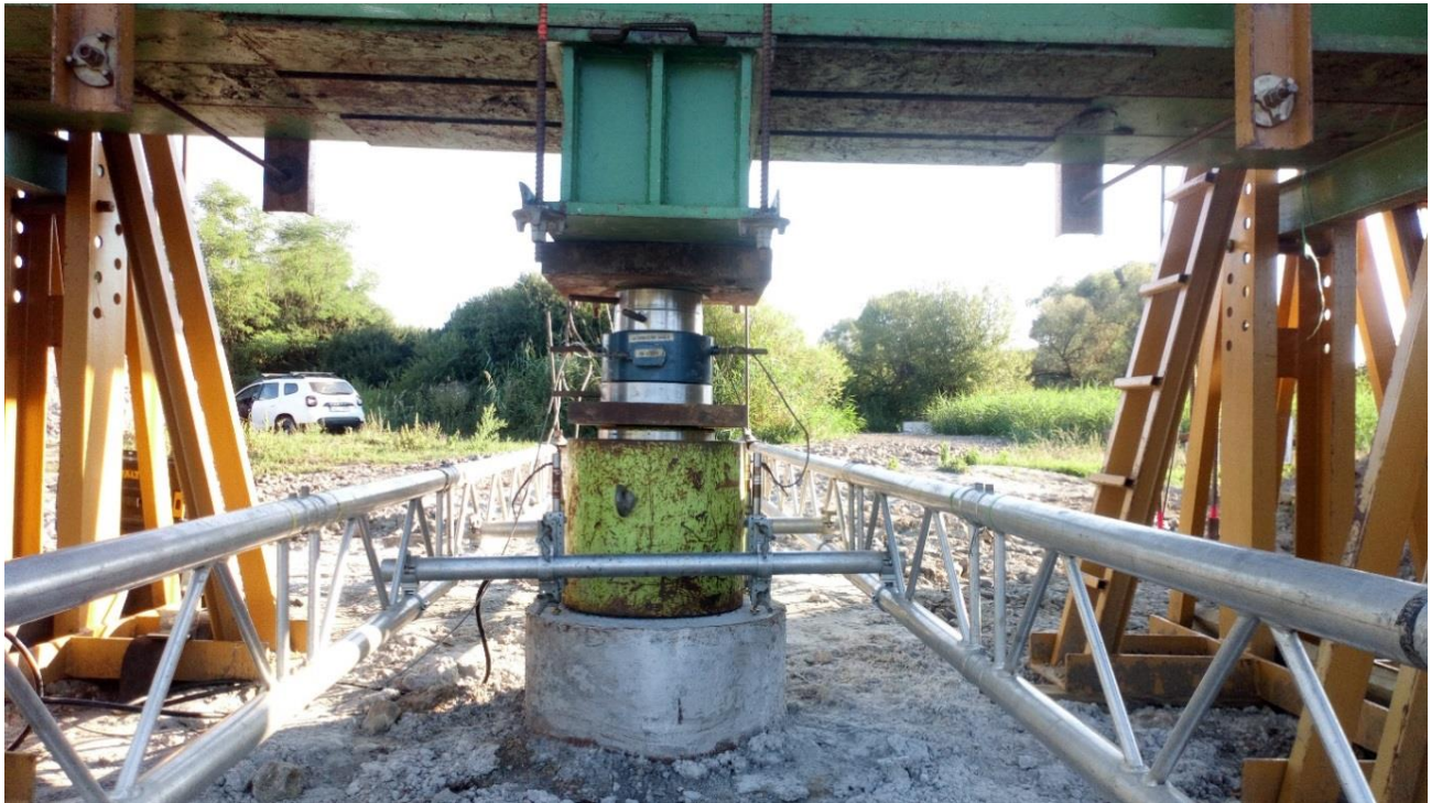
Paralelne bola odštartovaná výroba ocelevej konštrukcie mosta.